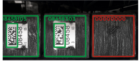
SR 250 markalanmamış kütüğü tanır