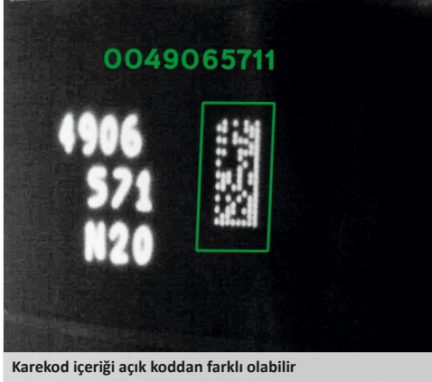
Karekod içeriği açık koddan farklı olabilir