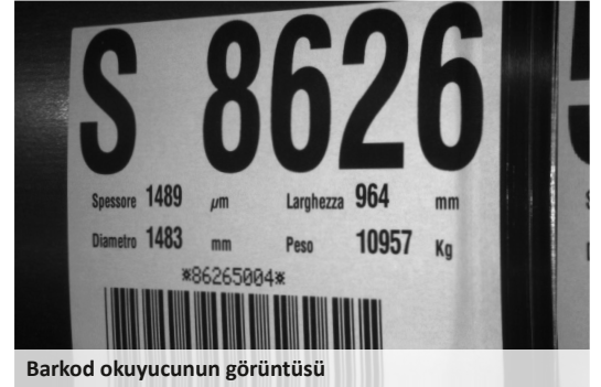
Barkod okuyucunun görüntüsü

Yeniden doldurma işlemi kolaydır ve çok kısa sürer. Sistem, isteğe bağlı olarak daha uzun otonomi, daha fazla hata toleransı sağlamak ve ilk yazıcının etiketleri bittiğinde etiketsiz ürünleri önlemek için ikinci bir yazıcı ile donatılabilir.