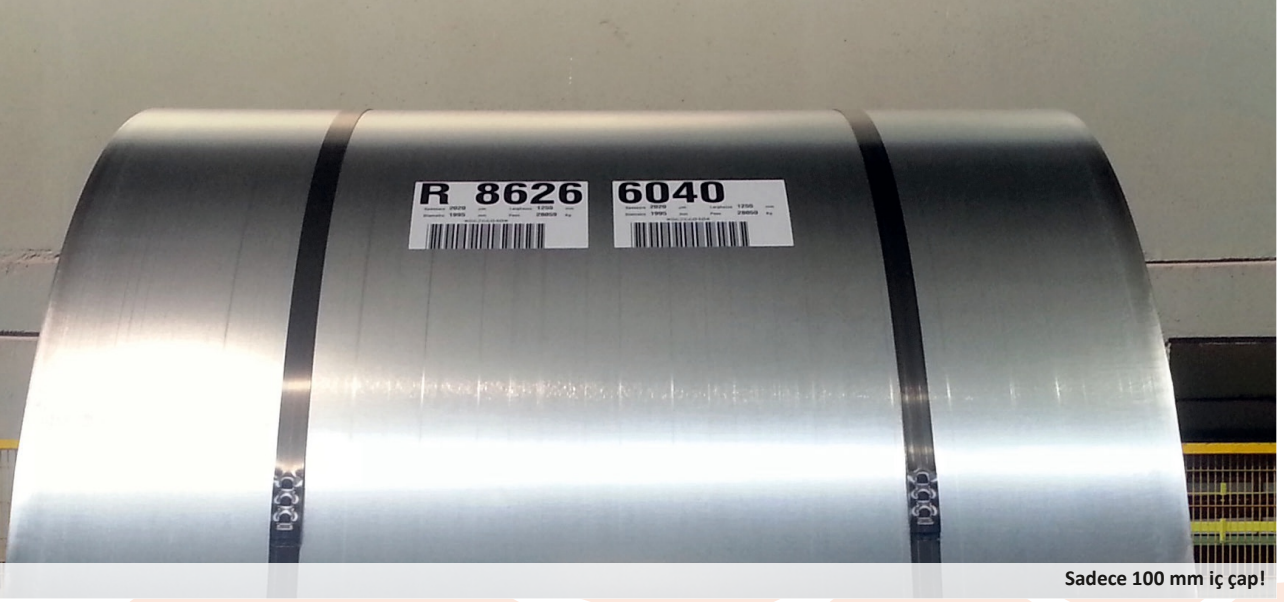
Sadece 100 mm iç çap!

Genel/özel kağıt veya plastikten çok ince metale kadar etiketler için çok geniş bir malzeme yelpazesi mevcuttur. Yapıştırıcı, etiketin tamamına veya bir kısmına uygulanarak kalıcı veya çıkarılabilir uygulama için kullanılabilir. Kısmi yapıştırıcı ve şerit algılama seçeneği birleştirildiğinde, etiket sadece şeride yapıştırılabilir ve şerit çıkarma işlemi sırasında çıkarılabilir.